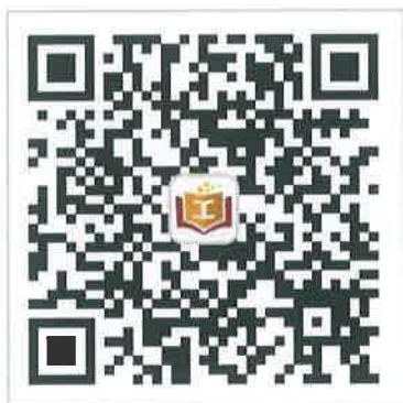
广东职工教育网公众号

第一步 关注广东职工教育网公众号（gdzgjy）选择微教育栏目“学历提升”进行求学圆梦公共服务平台