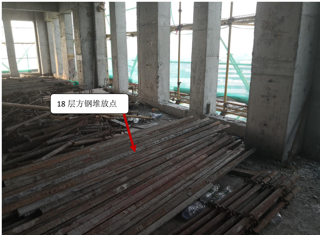
图 3：事故现场图（18层方钢堆放点）