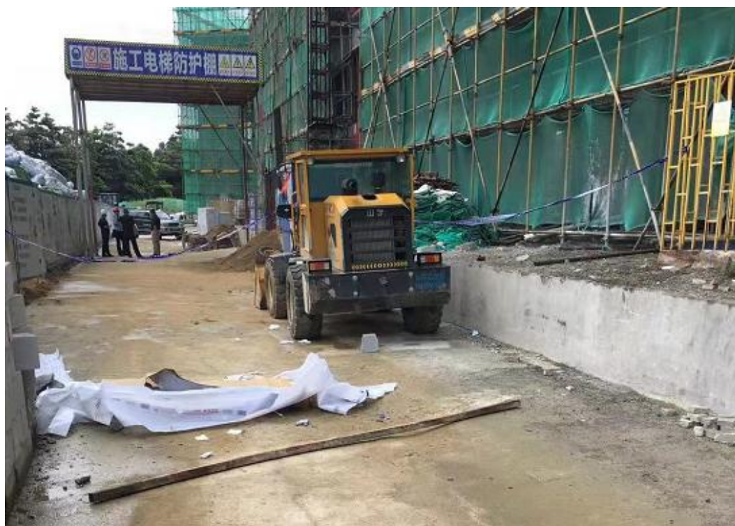
图 1：事故现场图（方钢坠落点）