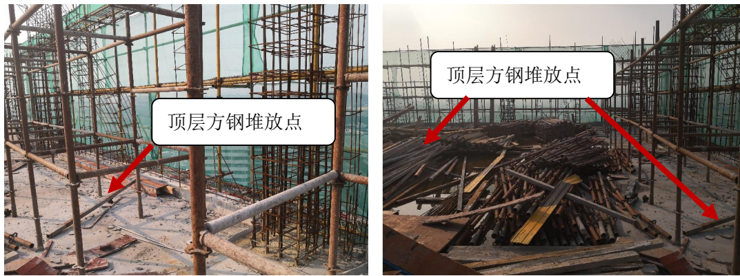
图 4：事故现场图（顶层方钢堆放点）