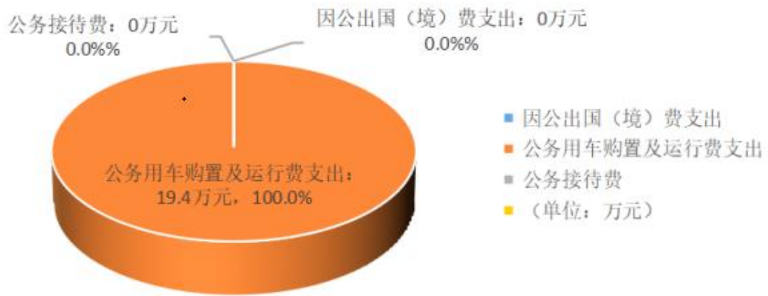
图：“三公”经费本年支出结构