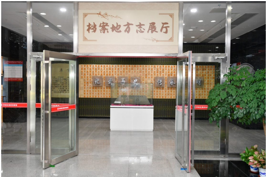
档案地方志展览大厅正门