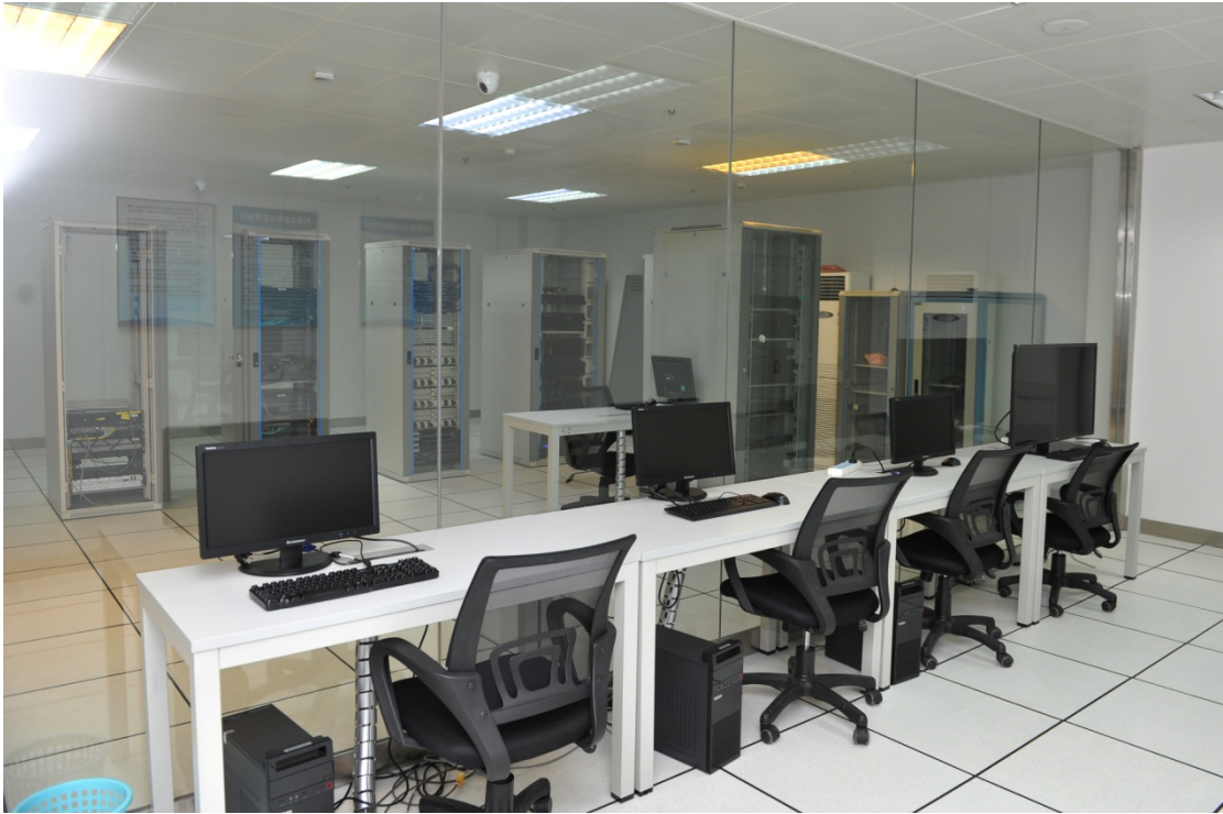
区数字档案馆局域网机房