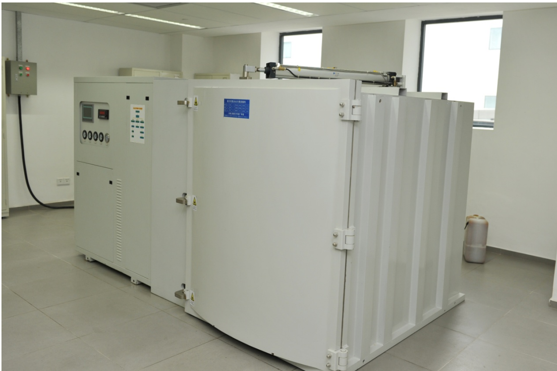
消毒室档案消毒设施