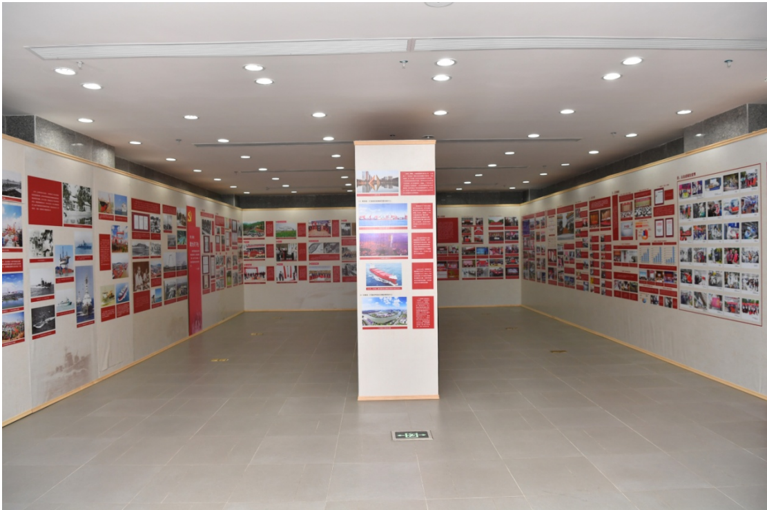
档案文献展展出区国家档案馆馆藏及征集的档案文献 400 余件