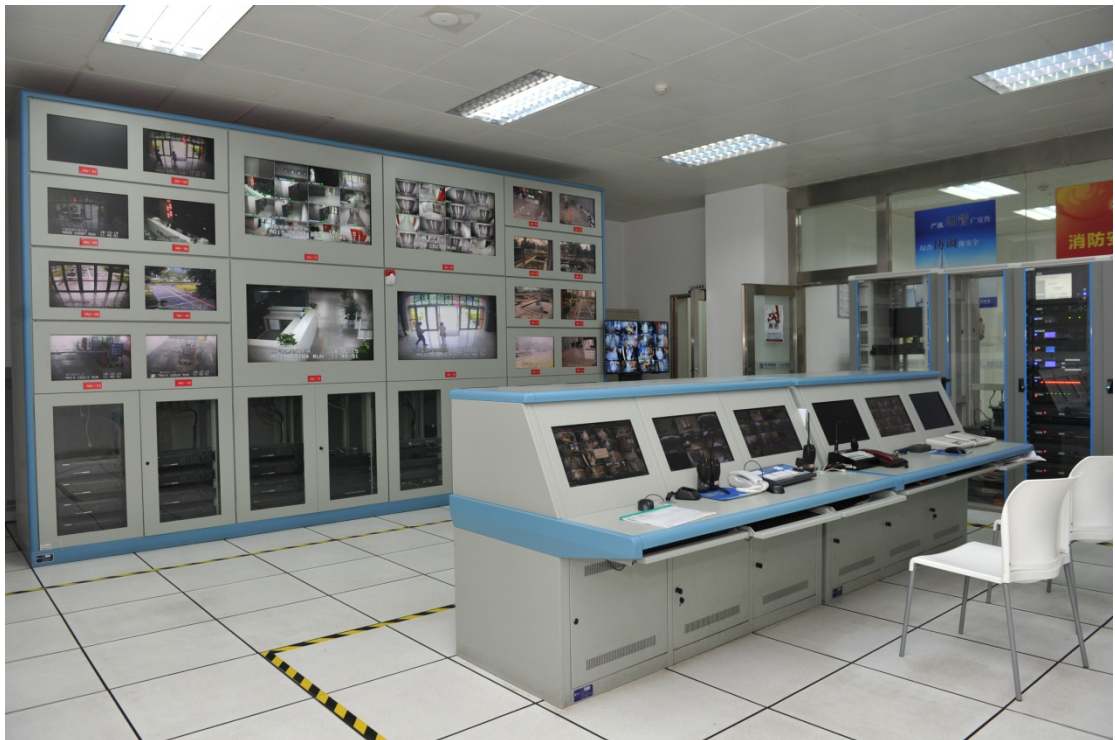
区图书档案大楼监控中心