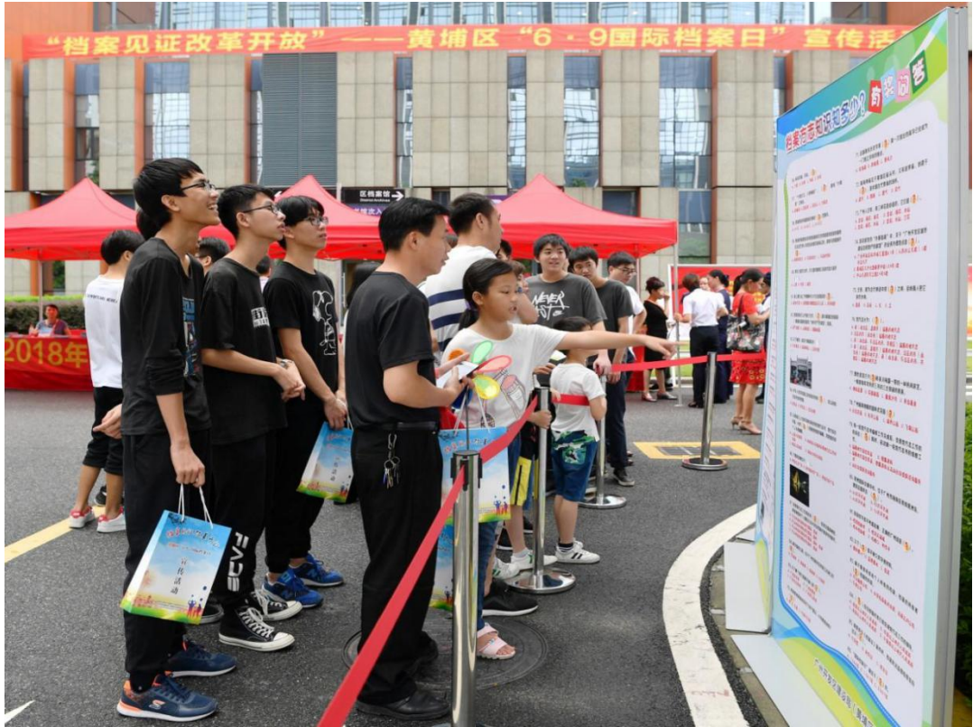
2018年6月9日“国际档案日”黄埔区国家档案馆活动现场