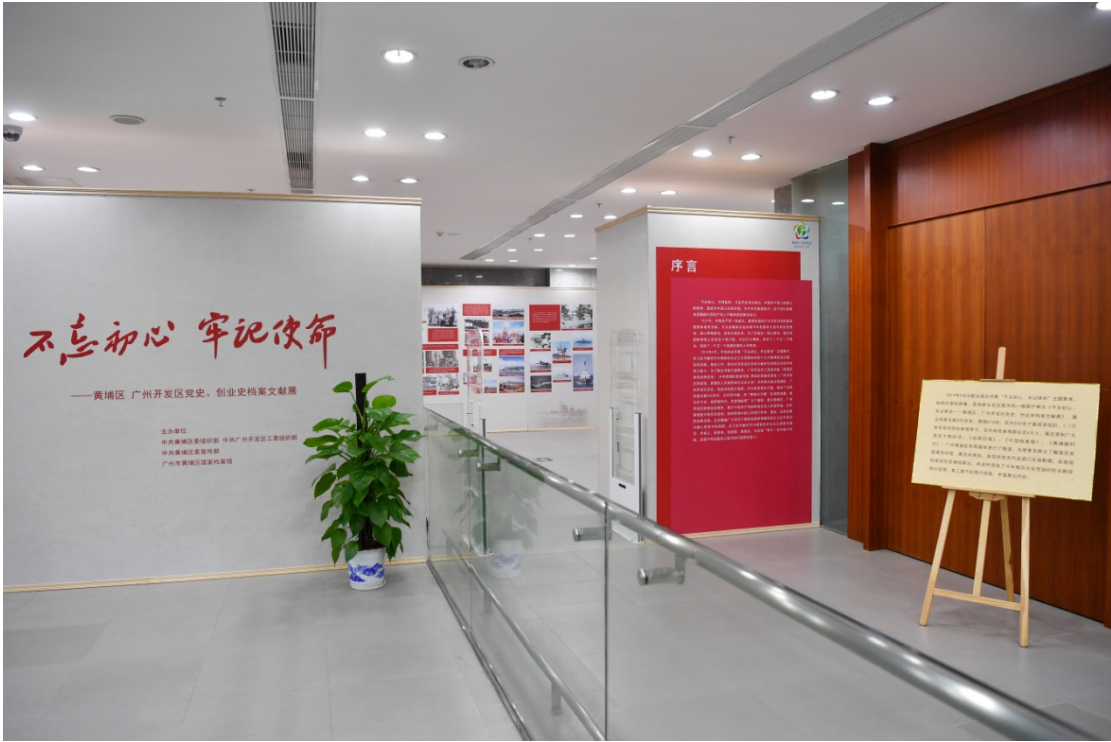
2019 年黄埔区国家档案馆牵头举办“不忘初心，牢记使命”主题教育档案文献展