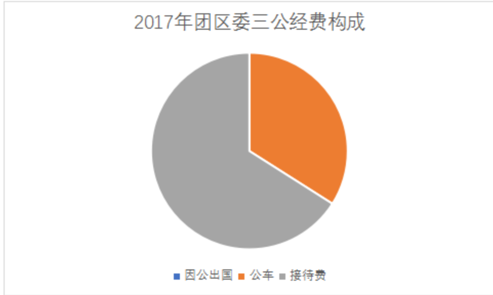
2017 年“三公”经费本年支出结构

3. 公务接待费支出 2.62 万元，主要用于 中新青年交流项目 。 2017 年，委机关 共接待国外来访团组 1 个，来访外宾 36 人次；发生国内接待 0 次，接待人数共 0 人， 主要包括新加坡人民协会青年运动一行 6 人，6 天的外事接待