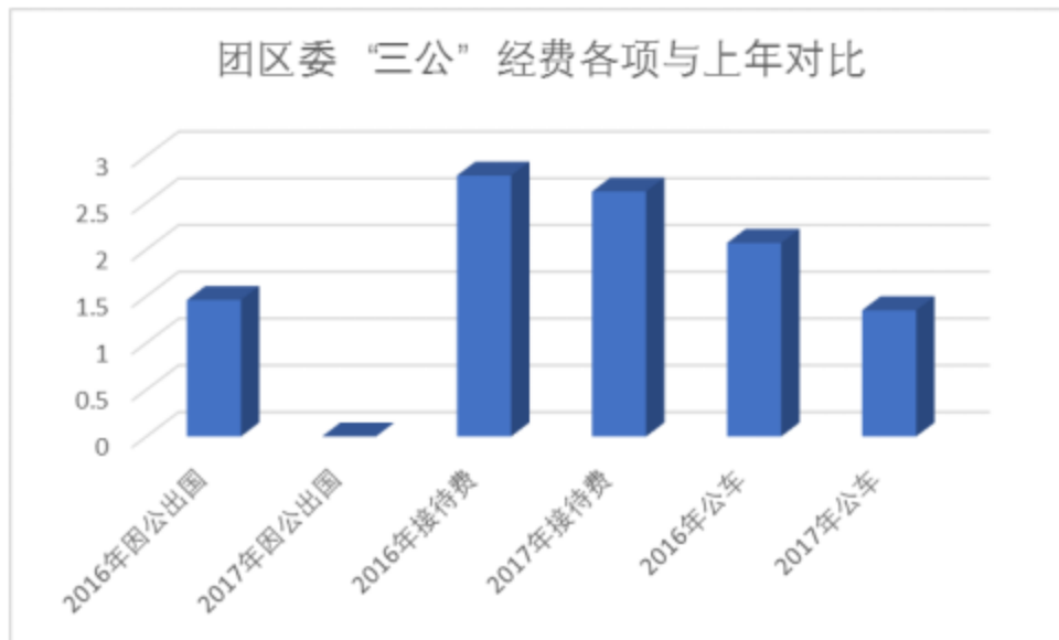
柱形图“三公”经费各项与上年对比