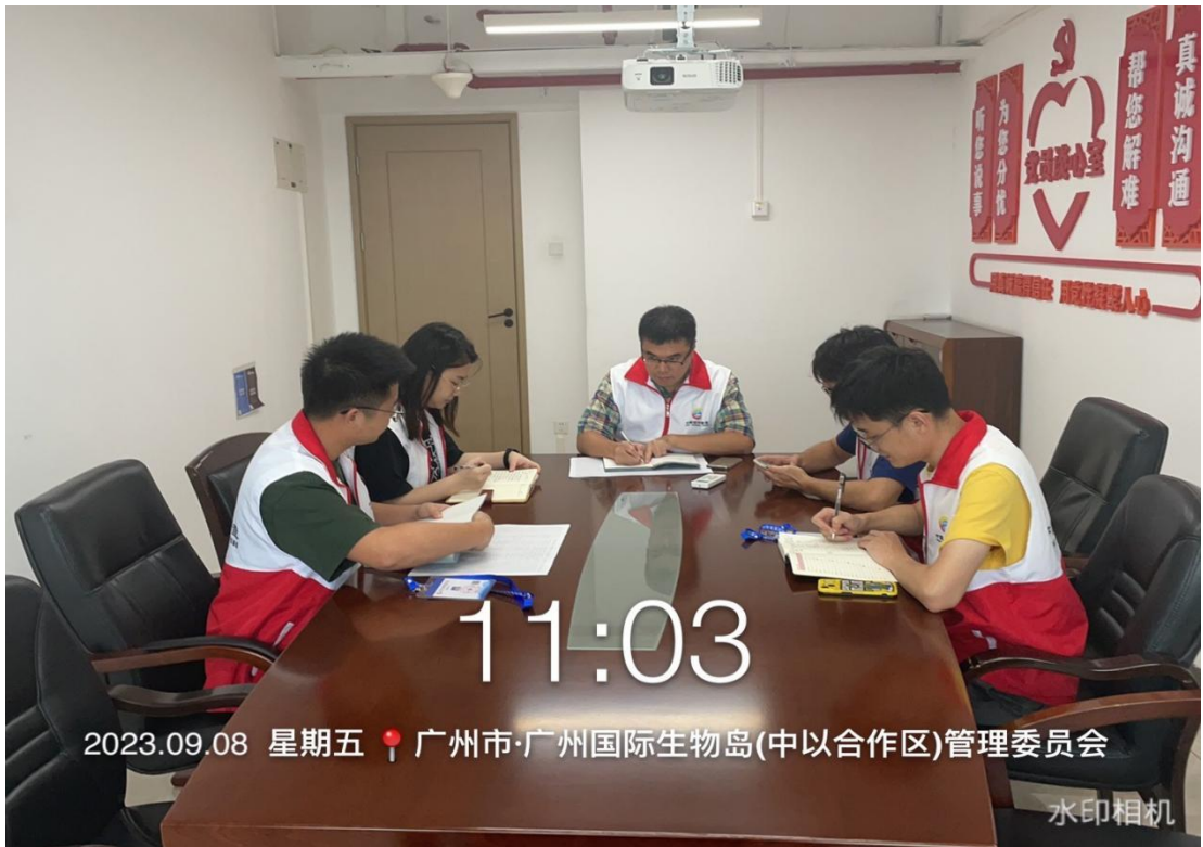
2023.09.08 星期五 广州市·广州国际生物岛(中以合作区)管理委员会