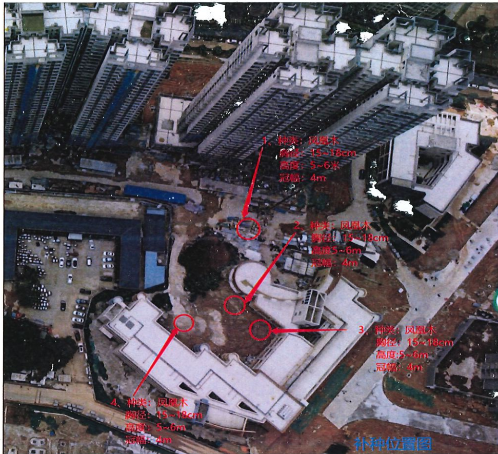
(2) 拟补植树木详见下表