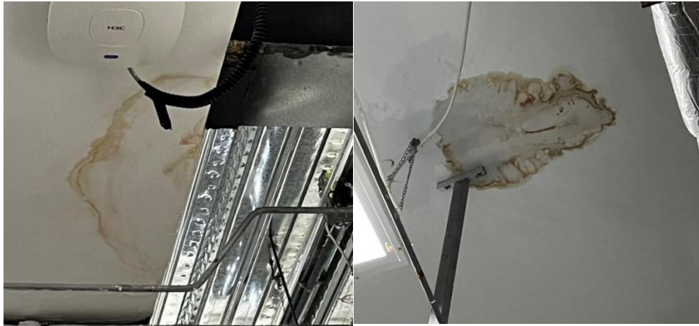
图 4-27 楼库房天花渗水