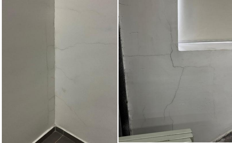
图 4-1 7 楼库房室内墙壁开裂

合格之日起 15 日内将有关文件提交备案。其中，消防验收总共进行了 2 次，第一次验收不通过的主要原因为：施工方使用了不合格的建筑材料。侧面反映出监理工作仍有疏漏，未能提前发现施工材料质量问题，影响后续项目档案验收备案工作。